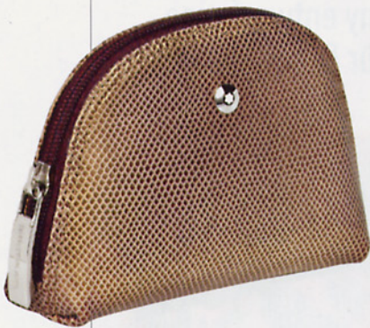
Satteltasche. Kalbsleder in exotischer Lizardprägung ist das Material, aus dem die Kosmetiktasche „La Vie de Bohème“ ist. Von Mont Blanc, ab 95 EUR