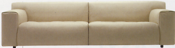
Am Lagerfeuer. Seine weiche Geometrie lässt das System „Soft Wall“ Harmonie mit seinem Benutzer erzeugen. Von Living Divani, ab 3.306 EUR