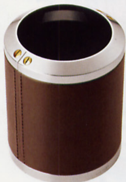
Schreibmunition. „Santos de Cartier“ – ein Bleistifttopf aus Leder, Paladium und Gelbgold. Von Cartier, ab 275 EUR